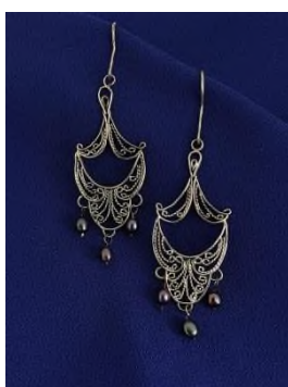
Серьги с подвижной вставкой из натурального черного жемчуга, выполненные в старинной технике филигрании. Мусихина Алёна