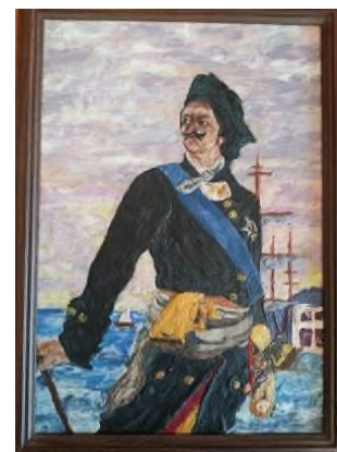
«Великий Петр Первый». Чистова Кристина